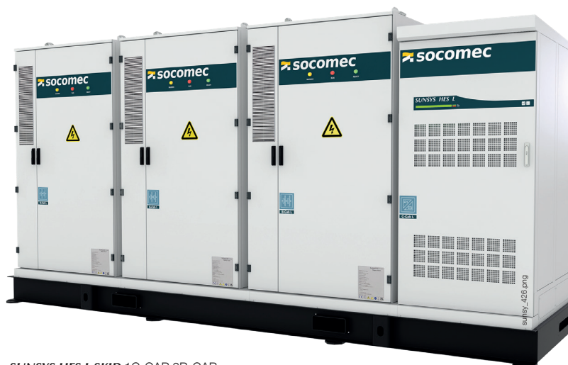
SUNSYS HES L SKID 1C-CAB 3B-CAB