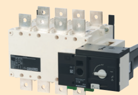
ATyS r Sistemi di commutazione