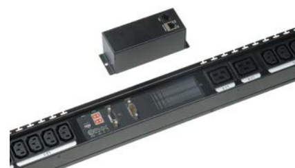
PDU 008 A

PDU VISION: interfaccia di gestione WEB/SNMP per il collegamento alla rete LAN. L'unità, adatta per il monitoraggio remoto, è integrabile nella PDU.