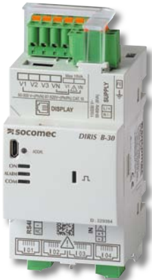
DIRIS B-30 RS485

根据IEC 61557-12标准保证测量精度： • 2%至120%额定电流范围内整体测量精度为0.5级（与TE/TF电流互感器配套） • 单独仪表精度为0.2级