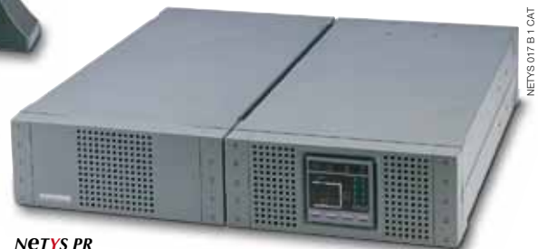
NETYS PR 1500/2000 ВА (Версия для установки в стойку)