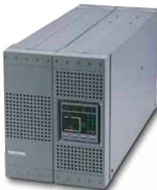
NETYS PR 1500/2000 ВА