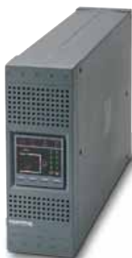
NETYS PR 1000 ВА