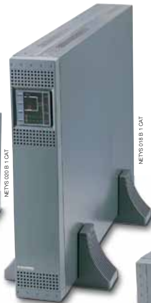
NETYS PR 3000 ВА