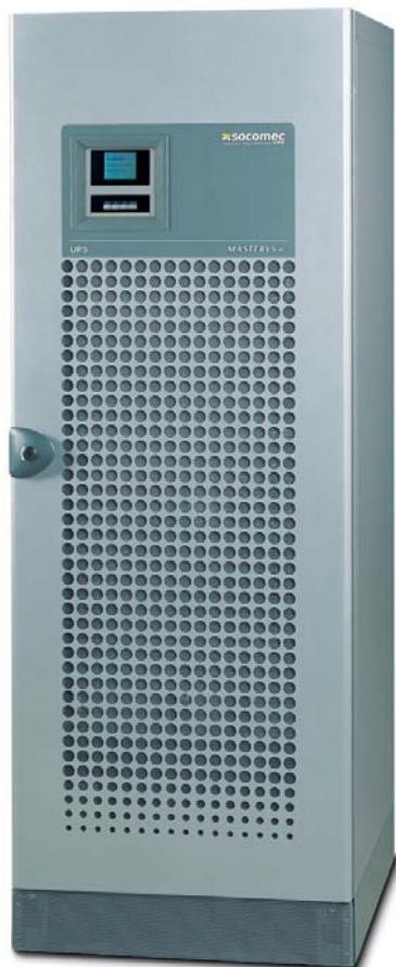
MASTE 050 A