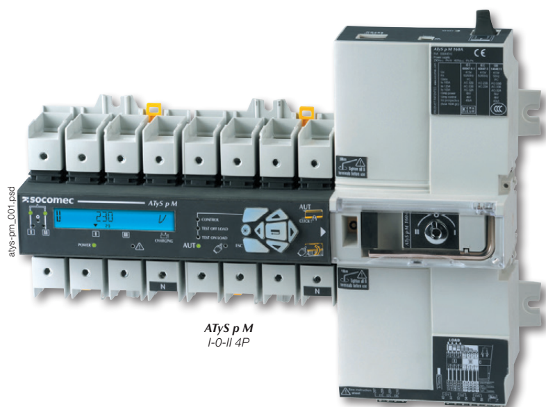
ATyS p M I-0-II 4P