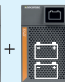
Espansione modulare della batteria N+1 con 1 o 2 stringhe