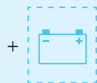
Armadio batteria esterno