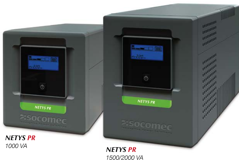
NETYS PR 1000 VA

Protezione affidabile a ingombro ridotto da 1000 a 2000 VA - Mini Tower