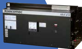
ATyS d H

Impiego: associabile con qualsiasi gruppo elettrogeno esterno o controllore ATS